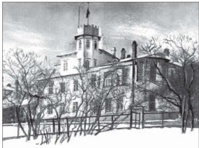
Дом Янковских в имени Сидеми . 1920 г.